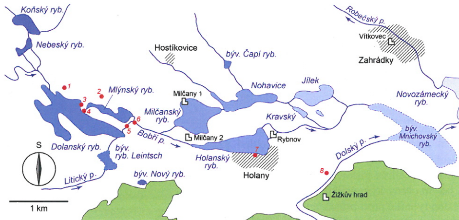
Mapka okolí Holan s vyznačením zaniklých a stávajících vodních ploch, hradů a zajímavých míst. Číslování zajímavých míst odpovídá číslům v textu. Rybníky jsou tónované podle jejich nadmořské výšky od temně modré (přes 270 m n.m.) až po velmi světle modrou (níže než 255 m n.m.)

Litickým potoce pod Rájem existoval kdysi rybník Leintsch , který také využíval nepropustného jílovcového podloží. Na rozdíl od ostatních rybníků holanské soustavy tu ale chybí pískovcová kra, které by bylo možné využít jako přirozené hráze. Úlohu pískovců tady převzalo drobné těleso čediče, které zpevnilo okolní jílovce do té míry, že v podobě drobného návrší převyšují dno údolí asi o 6 metrů. Jádro hráze tak bylo připravené a stačilo jen dosypat zeminu po straně návrší.