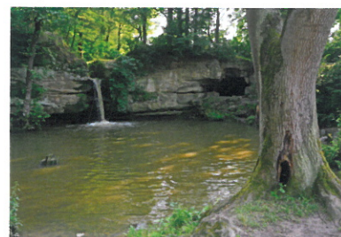
Napravo od vodopádu na Litickém potoce je vysekaná skalní místnost, dobře přístupná za nižšího stavu vody. Pohled od Hrázského mlýna, dnes zcela zaniklého

Dolanský rybník na východě končil sypanou hrází, na jejímž severním konci dodnes stojí kříž. Teprve nedávno, před asi 40 lety, byl rozšířen východním směrem o dalších 450 m. Tím zatopil i koryto nedaleko tekoucího Litického potoka, který tak nyní protéká skrz rybník. Na následujících 200 metrech toku Litického potoka se nacházejí tři tůně.