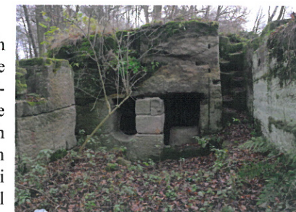
Ve vstupu do podzemní části mlýna na hrázi Dolanského rybníka je vidět vybrání pro hřídel mlýnského kola o průměru 60 centimetrů