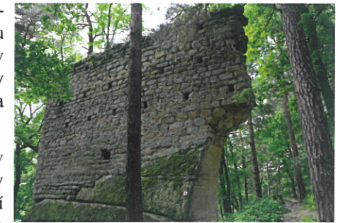
Zbytky hradu označovaného jako Kikelsburg

době, kdy vodní hladina Milčanského rybníka byla nejhodnější přístupovou cestou na Kikelsburg . Zdi hradu Kikelsburg byly později rozebrány a kamenné kvádry byly v letech 1775–1778 použity na stavbu kostela Sv. Magdaleny v Holanech.