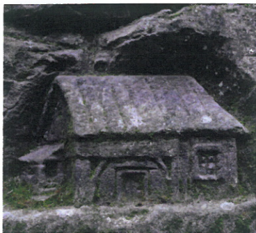
Reliéf roubenky s pavlačí a kouřícím komínem od neznámého autora, zkrášlující stěnu opuštěného pískovcového lomu

Výškové rozdíly mezi jednotlivými stupni „holanské kaskády“ jsou kolem 2 až 4 metrů, což poskytovalo dostatečný vodní spád pro budování vodních mlýnů. Mlýn s pilou stál u průrvy na hrázi Dolanského rybníka, Hrázský mlýn pak na hrázi Mlýnského rybníka vedle tůně s vodopádem. Také průrva vedle rybnovské tvrze v Holanech byla osazena vodním kolem už roku 1622 a později poháněla pilu. Vedle mlynářství se provozoval i chov ryb, doložený nedávnými archeologickými nálezy už k začátku 16. století.