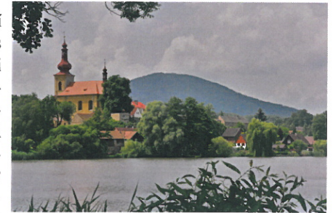
Pohled na Holany a Vlhošť od rybnovské tvrze

Klasické rybníkářství je v našem povědomí spojené především s jihočeskou krajinou, s Rožmberky a třeboňskými kapříky. Oproti tomu severočeská soustava rybníků na Bobřím potoce v okolí Holan nebo na Mlýnském potoce na Dokesku na první pohled působí jako špatný vtip: cožpak naši předkové nevěděli, že pískovec propouští vodu? S jakým obrovským úsilím asi museli zajistit dno rybníků proti průsakům? A kde vzali kámen na stavbu hrází? Nejsou ty rybníky jen nějakým novodobým výmyslem? Pokud ovšem začnete hledat odpovědi na podobné otázky, místo pochybností se rychle dostaví údiv nad geniální promyšleností zdejších vodních děl.