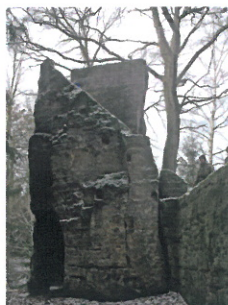
Na zinním Jiljově

Pískovcové skalisko s vysekaným schodištěm a vyhlídkovou věží leží východně od Holan, přímo pod obvodovou zdí renesančního loveckého záměčku na Žižkově vrchu. Polohou v bažinatém údolí Dolského potoka a příkopem kolem dokola vzbuzuje dojem vodního hradu. Německé obyvatelstvo nazývalo toto skalisko Veilchenburg , tedy „Fialkový hrad“, čímž se vyvolával dojem starobylého původu provedených stavebních úprav. August Sedláček, autor mnohosvazkového díla o českých hradech, navrhl jeho spojení se jménem Jiljov nebo také Liljov, zmiňovaným v historických pramenech. Veškeré zásahy na samotné skále jsou ale mnohem pozdějšího data a se středověkým opevněním nemají nic společného. Jak již někteří historikové poznamenali, skalní blok „Jiljova“ mohl spíše sloužit jako romantický výletní cíl pro návštěvníky nedalekého zámku v Zahradkách.