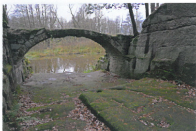
Široká průrva pod severním koncem hráze Mlýnského rybníka a tzv. Ovčí můstek