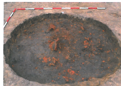
Sonda č. 3, sektor B 12 : svrchní vrstva podloží s bohatým nálezem již v hloubce 10 cm odkryvu objektu - stav po začistění .

za náplň spacího pytle z důvodu alergie peří, přešel Cimrman plynule na duté vlákno !!! Jednoduché a současně geniální řešení. Nové pytle získal snadno od přicházejících venkovanů a dutohlávky v okolí Čápu (později Čapu), kam mezitím Cimrman přesídlil, bylo dostatek. Mistrovu alergii i celosvětovou premiéru použití dutého vlákna pak definitivně potvrdil nečekaný a vpravdě zásadní nález, o němž vám budeme referovat v příštích kapitolách – máte se na co těšit, vážení přátelé. V jedné z dochovaných listin zmíněného nálezu Cimrman píše: