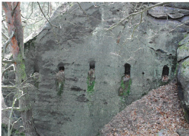
Kapsy pro zhlaví trámů podlahy na severní straně.