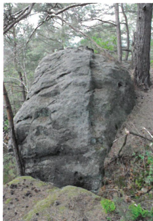
Přisekání skály pro založení zdíva.