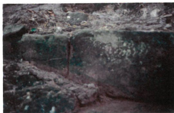
Pozůstatky kvádríkového zdiva hradby.