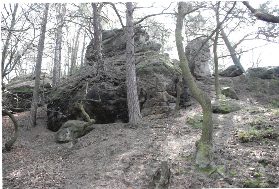
Nevelké skalní bloky sídla.

skutečně na skále nějaké sídlo stálo. Hlavou se mi honila řada nápadů, ale vylučovací metodou zbyla vedle hradu jen vesnická usedlost. Jenže vesnická usedlost vyžaduje pro svůj provoz pole, louky a vodu a ty na skalisku chybí. Pokorně jsem se vrátil k hradu, který zůstal tou nejpravděpodobnější variantou pro určení funkce a současně ukázal na to, jak oproti starším obyvatelům víme málo o svém okolí.