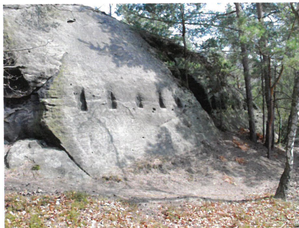
Stopy jižní zástavby.