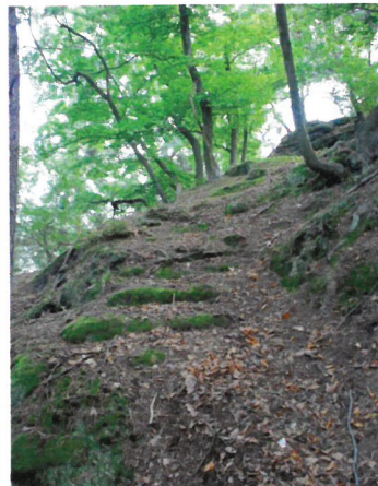
Schodiště vysekané v pískovcovém podloží.