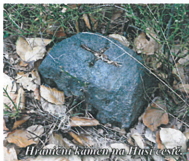
Husí kámen na Husí cestě

Pisčitou cestou, vedoucí smrkovým, většinou mladým lesem, stoupáme od útulné Skalky k výšině, brzy vpravo, brzy zas vlevo do zádumčivého skalního labyrintu pohlížejíce. Ohlédneme-li se, spatřujeme za sebou známý nám již, půvabně utvořený Vilhošť, jehož bizarní skalní útvary s této strany zvláště zřetelně vynikají, za ním pak v polokruhu řadí se hora k hoře, kužel ke kuželi; my však ku předu kráčejíce vždy hlouběji noříme se v tajemný skalní svět.