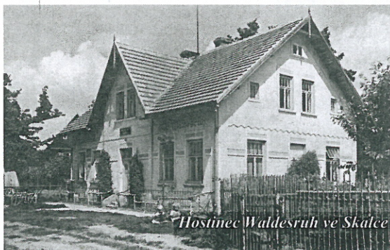
Hostinec Waldesruh ve Skalce a dnešní podoba domu.

Ačkoliv se jméno Husí cesta objevuje i na nejstarších mapách a určitě patří k nejstarším místním názvům na Roverkách, o jejím dopravním fungování v minulosti se toho moc neví. Ve středověku, kdy byly bažiny kolem Holan a Jestřebí pro vozy neprostopné, zřejmě byla hlavní spojnici mezi Úštěkem a Doksy. Na různých místech jsou dodnes patrné koleje vyjeté v pískovci. V průběhu času se pak její význam vytrácel, snad byla nahrazená vozovou cestou přes sedlo mezi Vlhoštěm a Malým Vlhoštěm. Na konci 19. století už byl její průběh v terénu tak špatně znatelný, že se doporučovalo najmout si v některé z okolních vsí průvodce, a vyhnout se tak úplnému zabloučení.